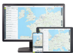
ABBONAMENTO A WEBFLEET